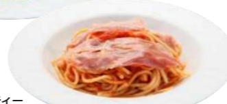
炙りベーコンと玉葱のスパゲティ