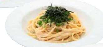
たらこのクリームスパゲティ