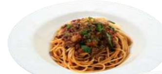
オリジナルボロネーゼ